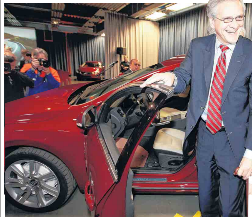
Kris Peeters loofde gisteren de dynamiek bij Volvo Cars in Gent.

Gent. Het stadsbestuur wil van het compacte model de ruggengraat van het wagenpark van Stad Gent maken.