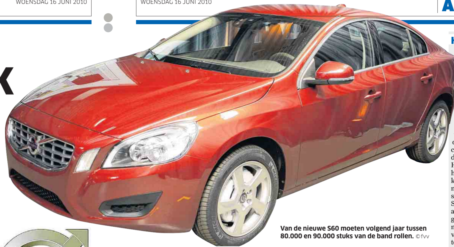
Van de nieuwe S60 moeten volgend jaar tussen 80.000 en 90.000 stuks van de band rollen.

TWEEHONDERD VACATURES RAKEN NIET INGEVULD